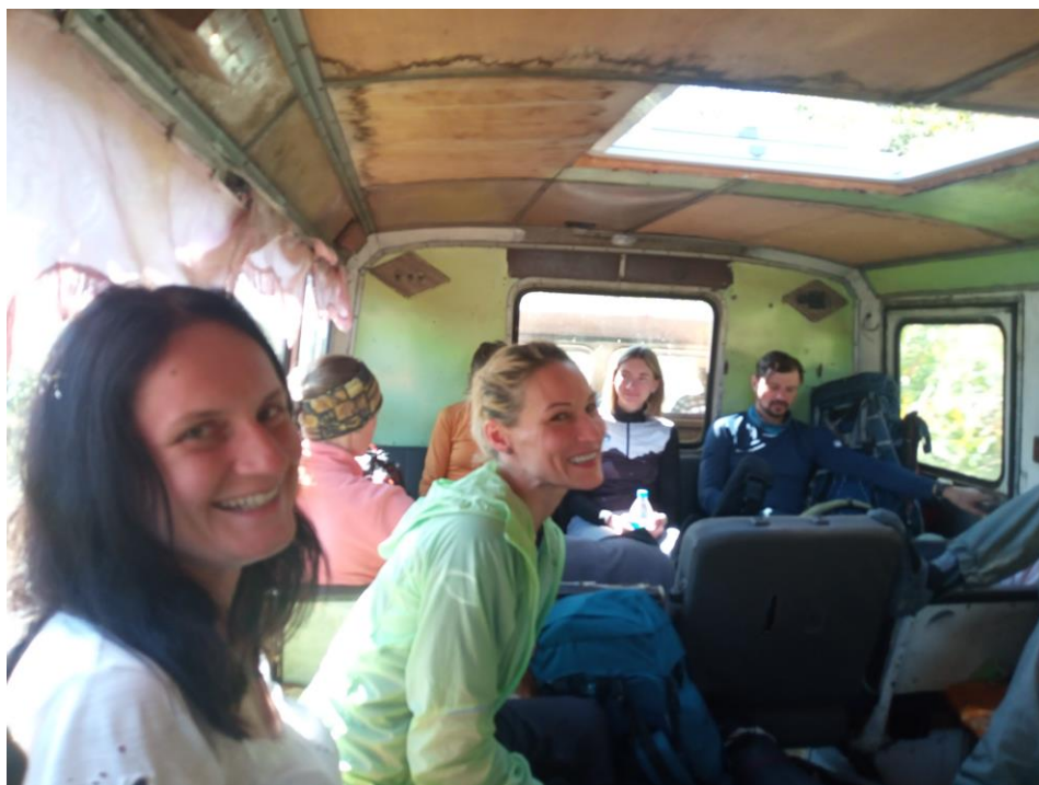
В чреве у нечисти скорее весело, чем жарко